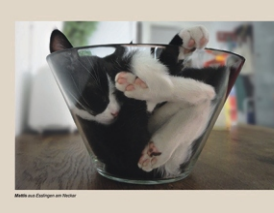
Mattis aus Esslingen am Neckar von Florian Rudd Gruppe Esslingen