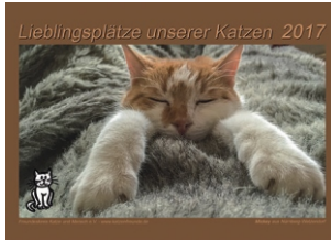
Mickey aus Nürnberg-Wetzendorf von Wolfgang Albert Gruppe Nürnberg