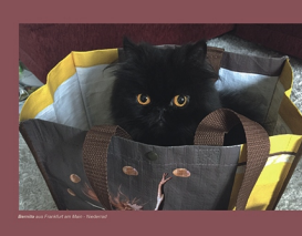
Bernito aus Frankfurt a.M.-Niederrad von Katrin Stelzer Gruppe Frankfurt am Main