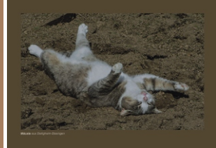
Mäusle aus Bietigheim-Bissingen von Karl Müller Gruppe Bietigheim-Bissingen